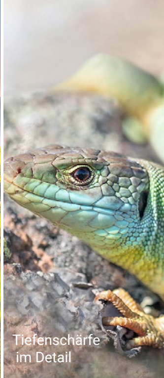
Tiefenschärfe im Detail